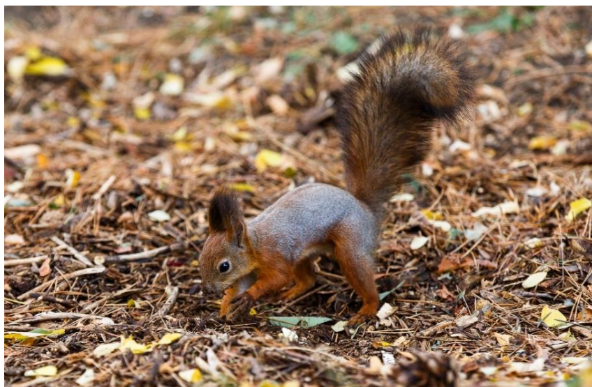
Рисунок 5 – Белка зарывает в землю орехи, прикрывая «кладовую» листовым опадом

2) Эндозоохория связана с адаптивной специализацией диаспор. Морфологически они очень разнообразны: костянки, многокостянки, ягоды, тыквины, яблоко. Все эти диаспоры экологически сходны двумя чертами: наличием съедобной ткани, которая своей окраской, запахом, вкусом служит специальной приманкой для агентов диссеминации и прочной защитой семени. Основными агентами эндозоохории в городе Краснодар являются птицы: дрозды, камышовки, зарянки, вяхри, свиристели, иволги, синицы (рисунок 6).