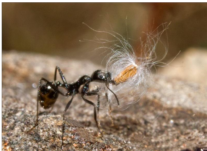
Рисунок 8 – Пример мирмекохории

Анемохория характерна для большинства растений города Краснодар и его окрестностей, диаспоры которых переносятся ветром. Для этого в процессе эволюции у них появились специальные аэродинамические приспособления, которые помогают им держаться в воздухе, замедляя их падение и оказывать сопротивление воздушному потоку. В зависимости от того, каким образом ветер перемещает диаспоры, различают несколько форм анемохории [6]: