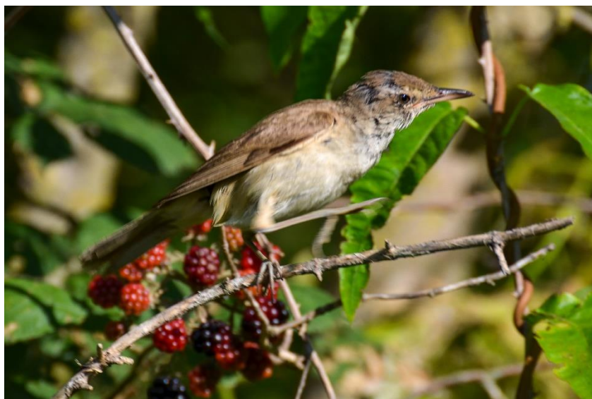
Рисунок 6 – Камышовка лакомится дикой ежевикой в лесопарке Солнечный остров

2) Эндозоохория связана с адаптивной специализацией диаспор. Морфологически они очень разнообразны: костянки, многокостянки, ягоды, тыквины, яблоко. Все эти диаспоры экологически сходны двумя чертами: наличием съедобной ткани, которая своей окраской, запахом, вкусом служит специальной приманкой для агентов диссеминации и прочной защитой семени. Основными агентами эндозоохории в городе Краснодар являются птицы: дрозды, камышовки, зарянки, вяхри, свиристели, иволги, синицы (рисунок 6).