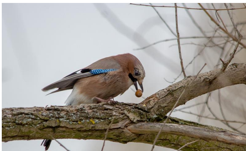
Рисунок 4 – Сойка делает запас в трещине коры дерева

В качестве животных-агентов синзоохории можно отметить: сойку, ворону, дятла (пестрый, черный, зеленый), белку (рисунок 4, 5).