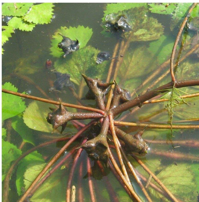
Рисунок 1 – Пример фотофиксации водного растения с плодами (внешний вид: рогульник плавающий)

3. Фотофиксация (рисунок 1, 2). Создание фотоматериалов, иллюстрирующих различные способы распространения семян и плодов.