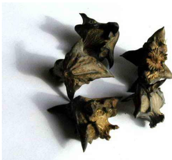
Рисунок 2 – Пример фотофиксации плодов водного растения (рогольник плавающий)