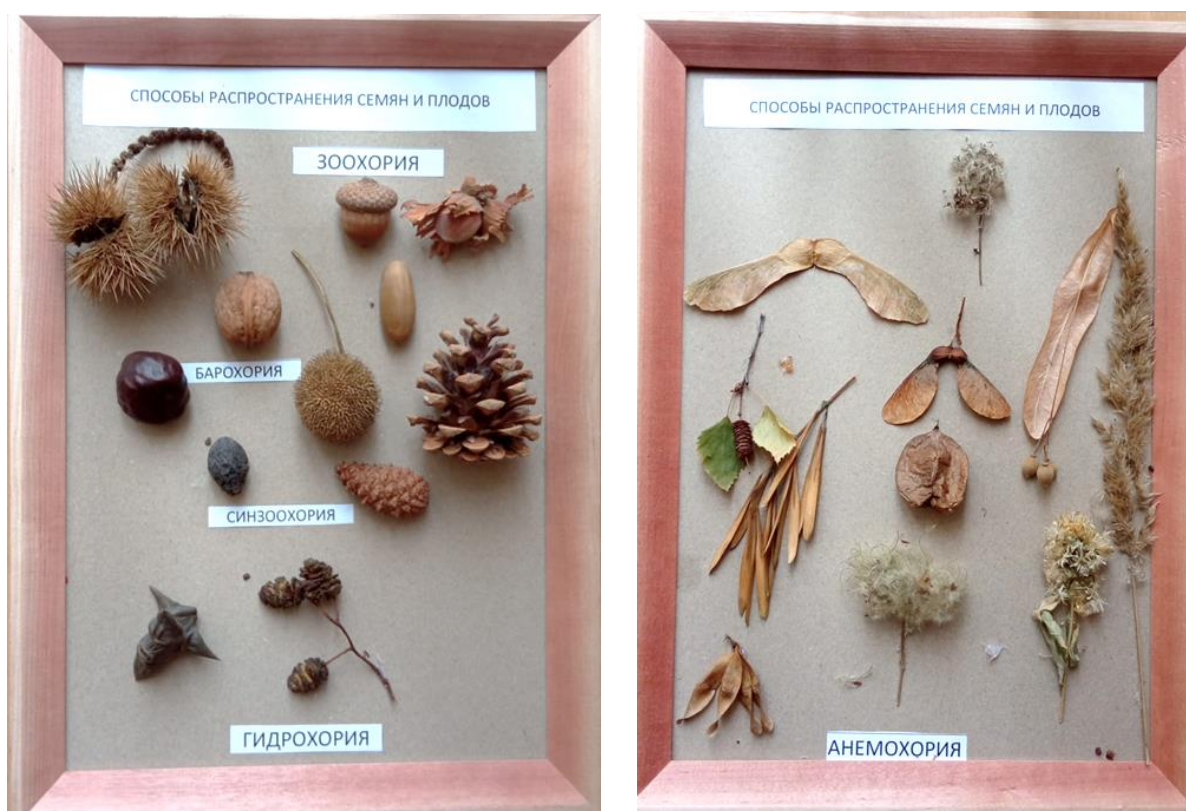
Рисунок 3 – Пример оформления демонстрационного материала (выполнен учащимися)