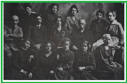
Преподаватели и учащиеся 3-й женской гимназии