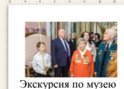
Экскурсия по музею