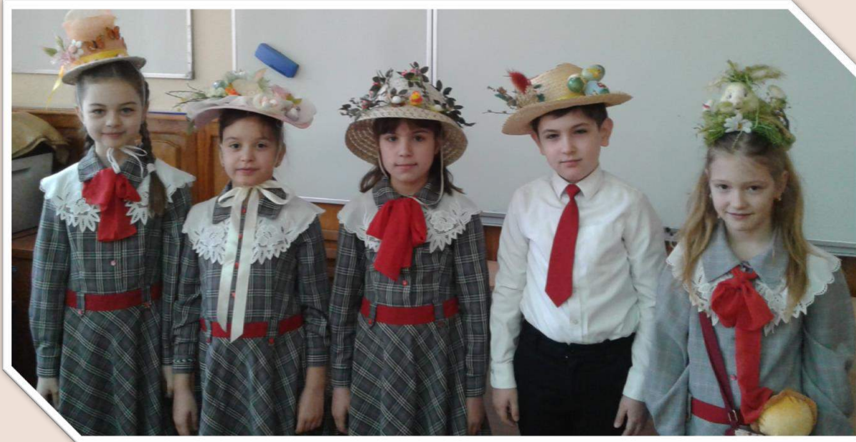
«Фестиваль Пасхальных шляп»