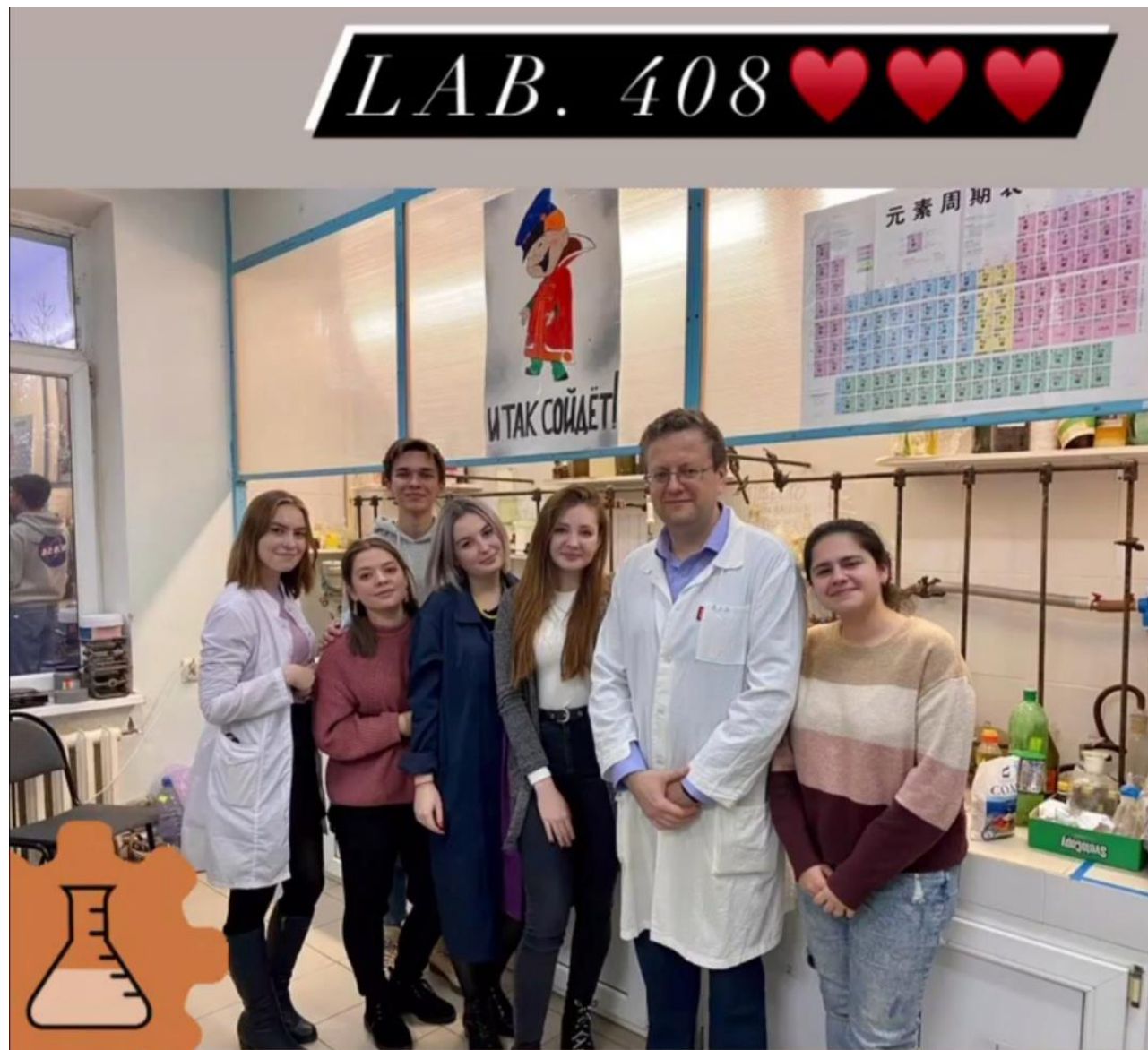
Наша лаборатория и научный коллектив