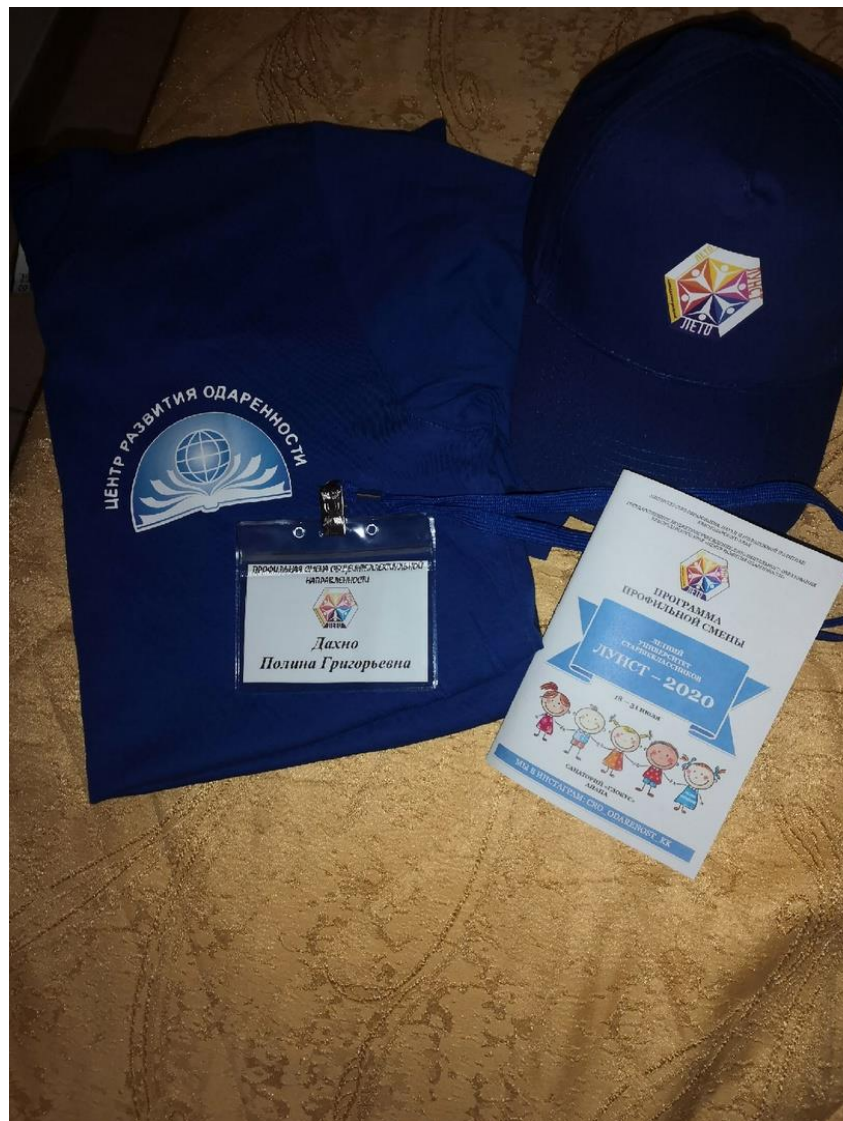
Летний университет старшеклассников